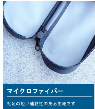
マイクロファイバー