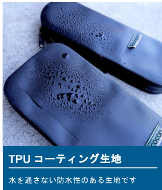
TPU コーティング生地