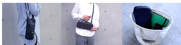
肩掛けスタイルとして